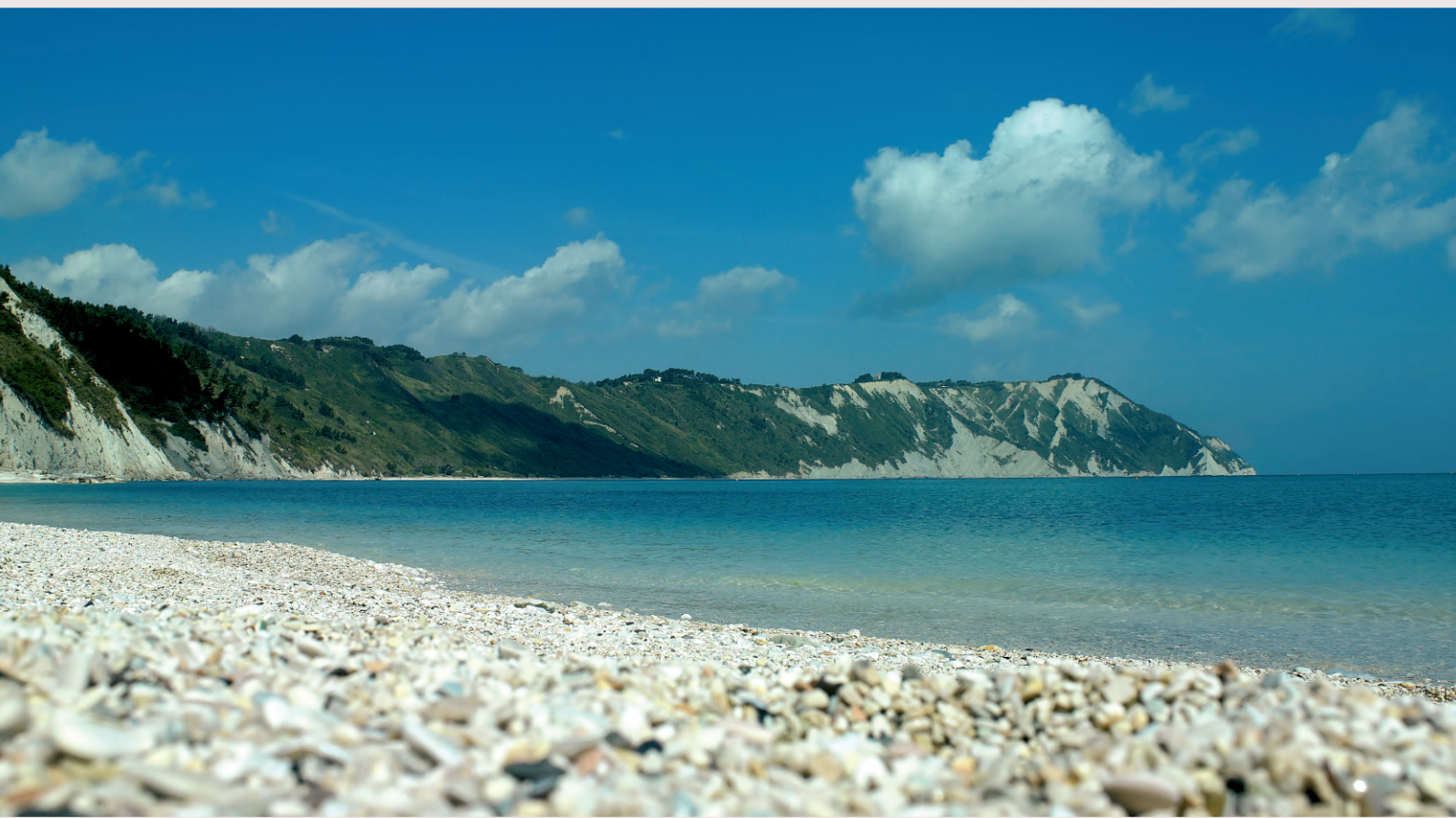
▼ Vista della baia dalla spiaggia di Portonovo