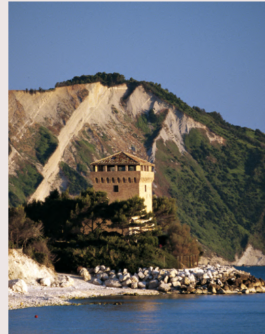
Torre de Bosis ▶

Se invece siete alla ricerca di pace e meditazione non potete mancare la millenaria Chiesa di Santa Maria di Portonovo citata anche da Dante Alighieri nella sua Divina Commedia: un piccolo gioiello di architettura romanica che vi lascerà sorpresi per la sua incredibile bellezza.